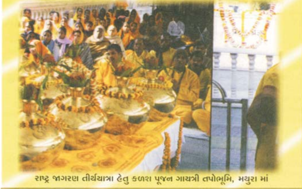
રાષ્ટ્ર જાગરણ તીર્થયાત્રા હેતુ કળશ પૂજન ગાયત્રી તપોભૂમિ, મથુરા માં