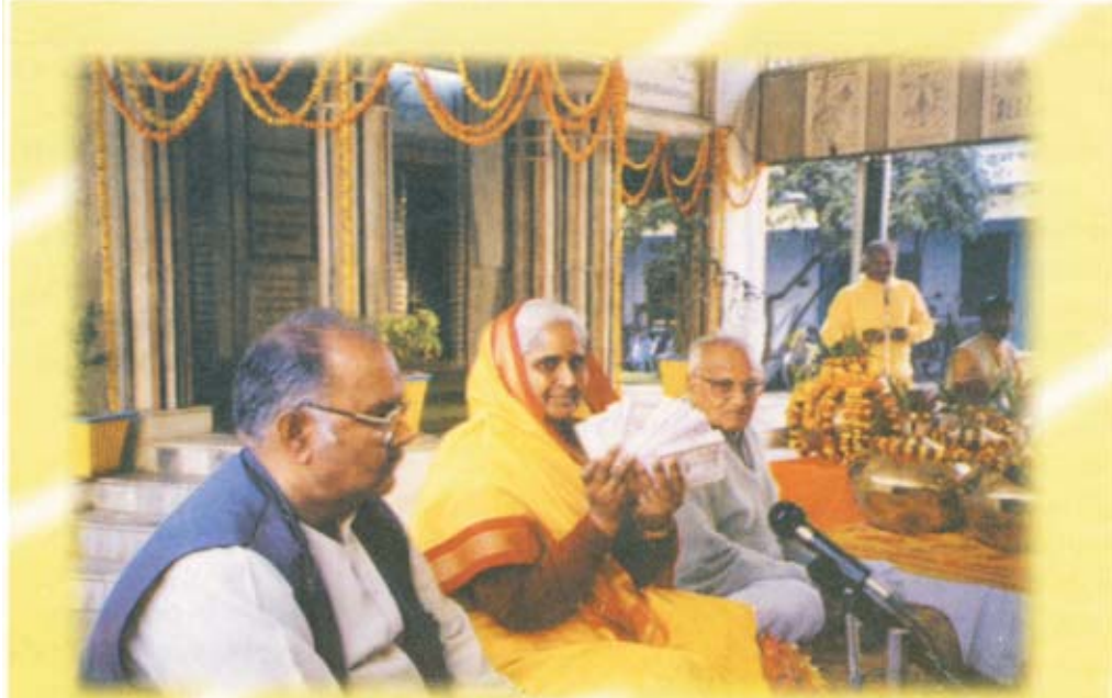
આદરણીયા શેલ ટીટી યુગ ચેતના સાહિત્યનું વિમોચન કરી રહ્યા છે ૩-૨-૨૦૦૦