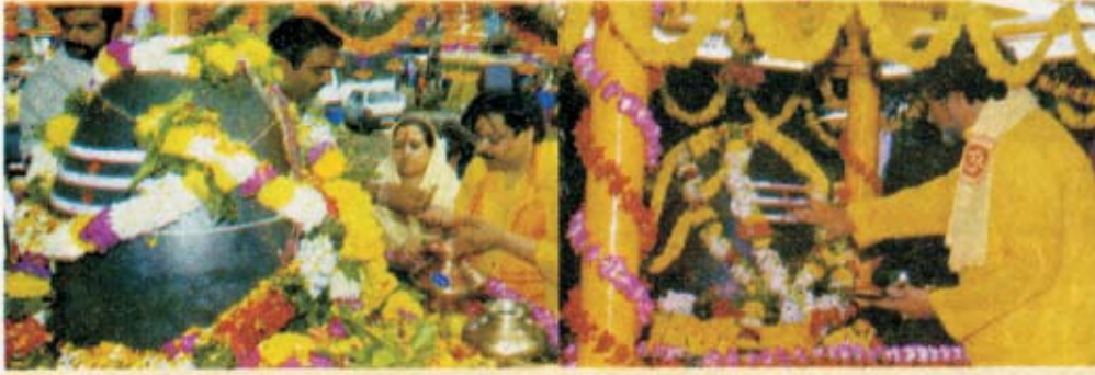
'મહાકાલ' જ્યોતિર્લિંગનું વિશેષ પૂજન