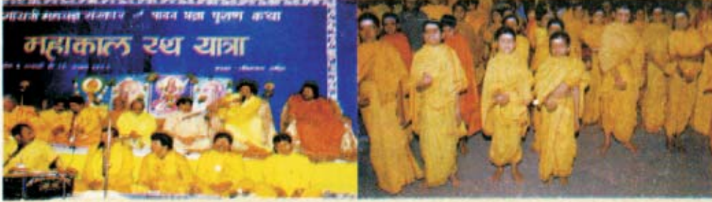
ભક્તિ ધામ-કૈલાશમઠ નાસિકથી થયેલ શુભારંભ.

R.N.I. 23434/71 YUG SHAKTI GAYATRI GUJRATI MONTHLY REGD.No. AG/MTR-39/03-05 Licenced to post without Prepayment. LICENCE- AG/MTR-01