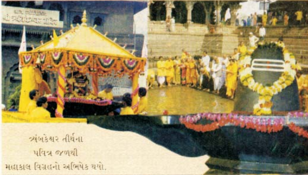
ત્ર્યંબકેશ્વર તીર્થના પવિત્ર જળથી મહાકાલ વિગ્રહનો અભિષેક થયો.

માસિક યુગ નિર્માણ યોજના ટ્રસ્ટ મયુરા માટે મુન્સુજીવ શર્મા દ્વારા પ્રકાશિત તથા યુગ નિર્માણ પ્રેસ મયુરામાં મુદ્રિત અને યુગ નિર્માણ યોજના ટ્રસ્ટ મયુરાથી પ્રકાશિત સંપાદક ડૉ. પ્રભુવંશીભાઈ, સર્વ સંપાદક-વનરામભાઈ વેલ્લે